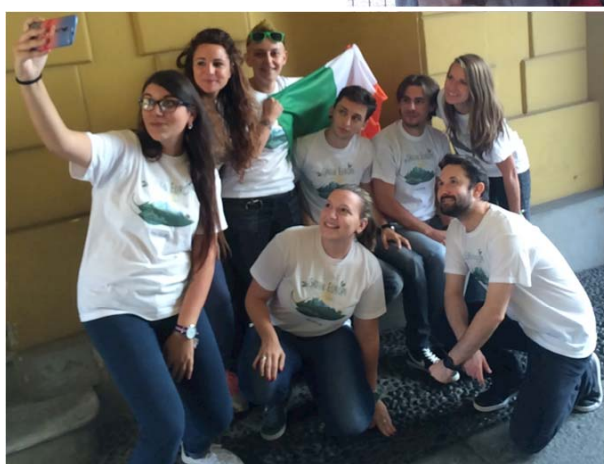
Sotto il "back stage" di un selfie, durante una pausa del corso di inglese.